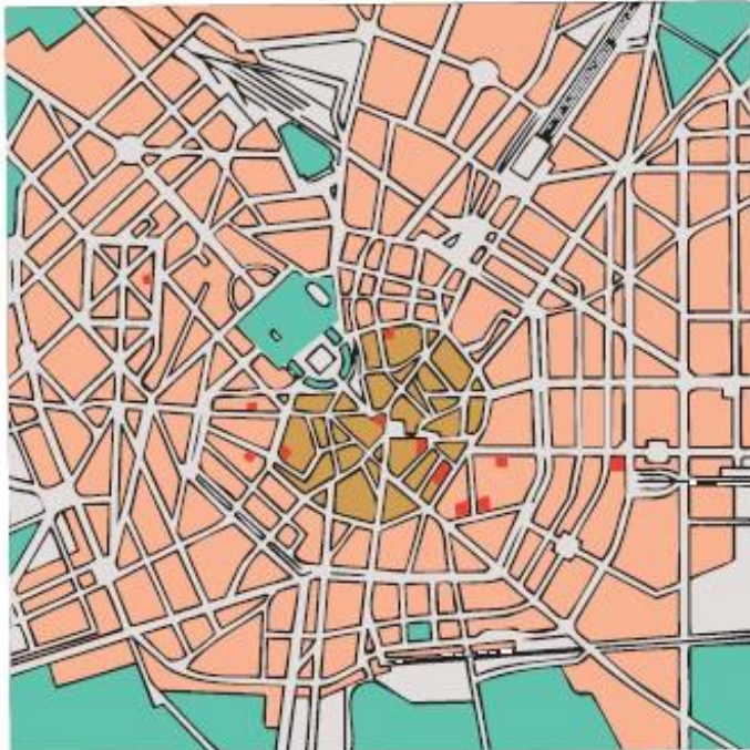
5 Plano general de Milán.