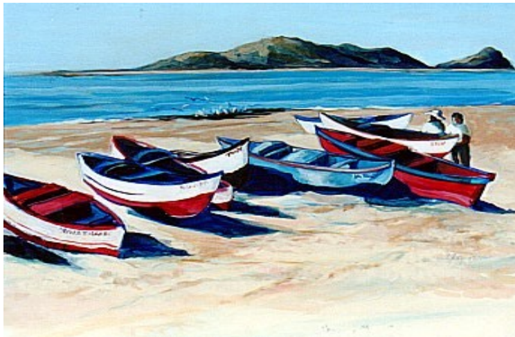
Barcos de pesca

La pesca consiste en sacar peces del agua para comérselos.