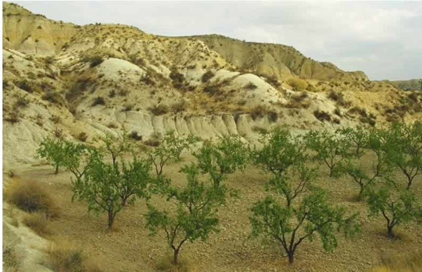
Árboles en secano

En el secano la tierra solo recibe el agua de lluvia.