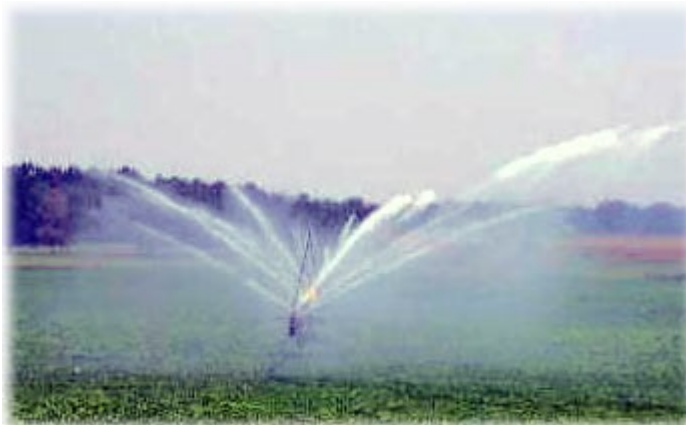
Spray irrigation in Michigan.