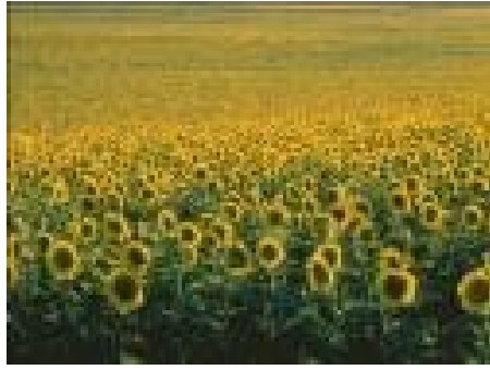
Campo de girasoles