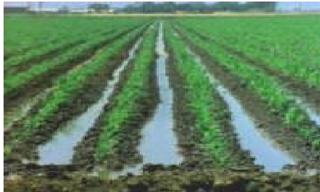
Cultivo de regadío