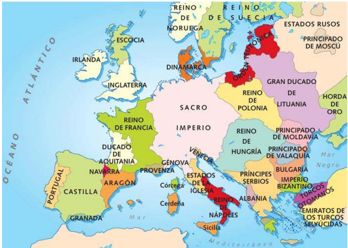
Europa en el año 1.500

Sin embargo, destacaron cuatro grandes reinos sobre el resto: Francia, Inglaterra, España y Rusia.