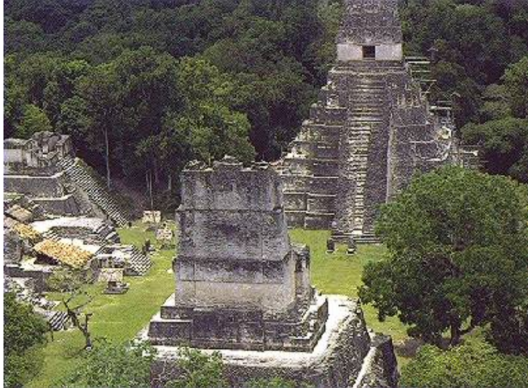
Ejemplo de construcción de los mayas