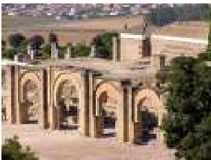
Restos de la ciudad de Medina Azahara en Córdoba