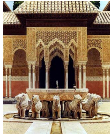
Fuente en el Patio de los Leones de la Alhambra de Granada